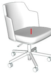
Fauteuils de visiteurs rotatif