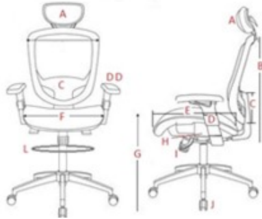
Tableau A1: Fauteuil rotatif