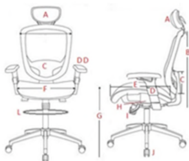
Tableau A7 : Fauteuil Rotatif – 1741 rue Brunswick, Halifax, Nouvelle Écosse, B3J 3X8