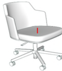
Fauteuils de visiteurs rotatif