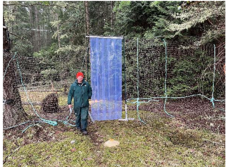
Figure 4 : Barrière pour piétons