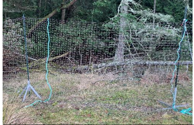
Figure 2 : Filet dans une zone ouverte, fixé à l'aide de poteaux autoportants