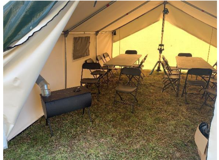
Figure 6 : Espace couvert et chauffé pour les repas et les loisirs