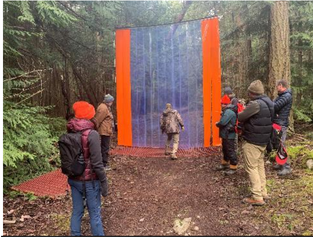
Figure 5 : Barrière pour véhicules