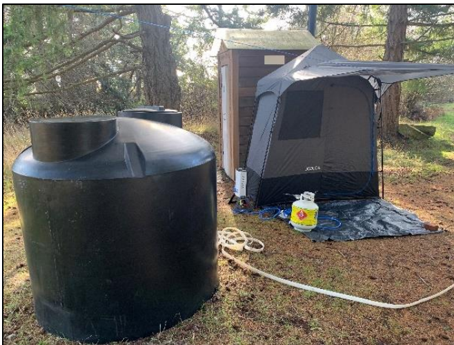
Figure 9 : Douche chauffée