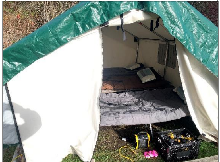
Figure 8 : Tente murale en toile avec lits de camp et sacs de couchage. Cette photo montre trois lits de camp, mais pour ce travail, il y aura deux lits de camp par tente. Les tentes murales seront également dotées de planchers, de cadres et de murs en bois.