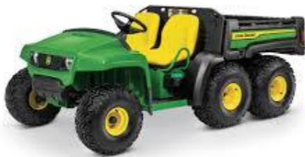
Figure 7 : VTT « Gator »