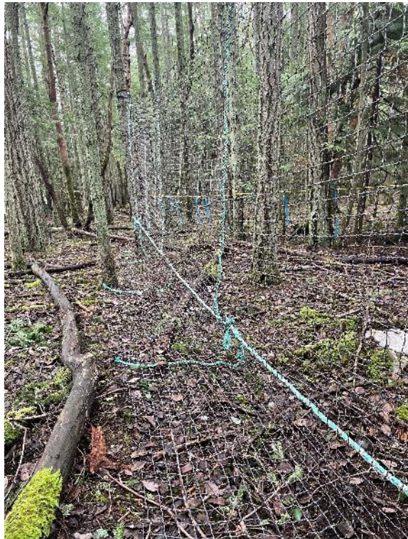
Figure 3 : Filet fixé aux arbres dans une zone forestière