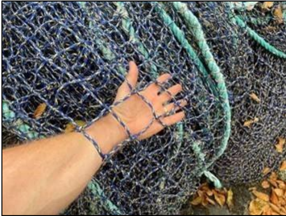
Figure 1 : Filet en PEHD