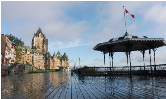
Figure 1 – Section de la terrasse Dufferin