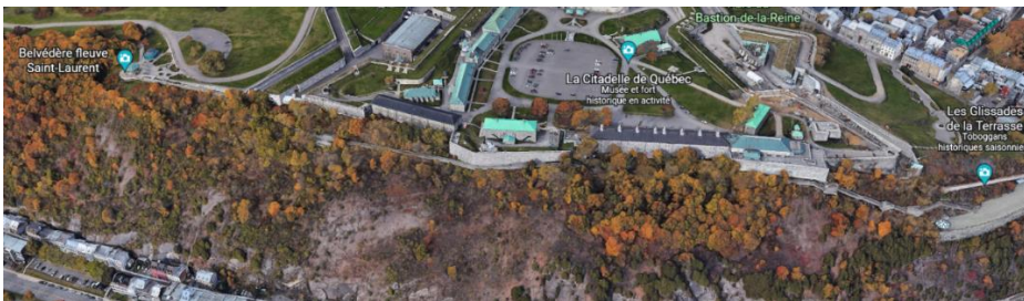
Figure 3 – Vue générale de la promenade des Gouverneurs