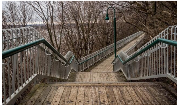
Figure 2 – Section de la promenade des Gouverneurs