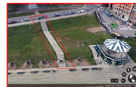
ESCALIER D'ACCÈS DU BAS JARDIN (COMPREND 2 VOLÉES D'ESCALIERS DE 9 ET 20 MARCHES AINSI QUE DES PALIERS)