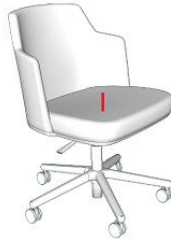
Fauteuils de visiteurs rotatif